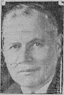
William Green es el presidente de la Federación Americana del Trabajo, cargo que desempeña desde 1924, en que murió Samuel Gompers. Aquí vemos la última fotografía de Green

de entrar en lucha con el trabajo en esas zonas.